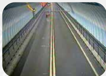
路上のオブジェクト