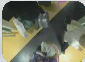
出口通路の逆行モニター