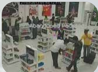
放置オブジェクト検知