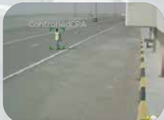
危険通路制限エリアの侵入検知