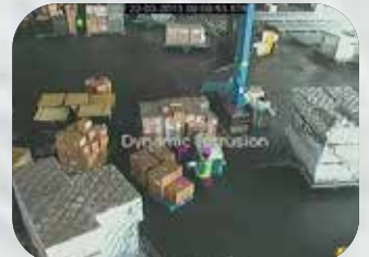
貨物積載ゾーンのセキュリティ