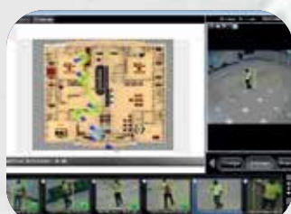
タグ&トラック (複数カメラでの追跡)