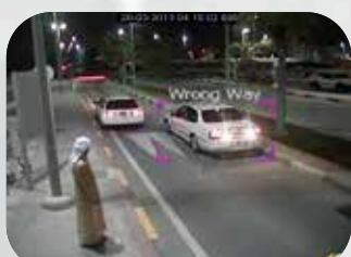
交通モニタリング