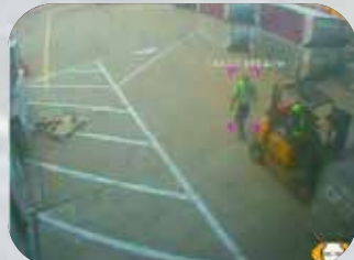
エアサイド侵入者検知