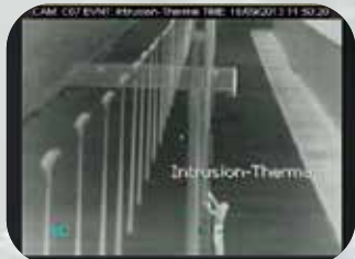
GPS座標による周辺保護