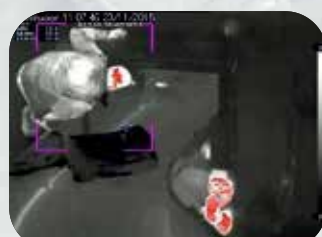
手荷物バックヤード不正侵入