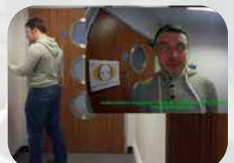
アクセスコントロール二重認証